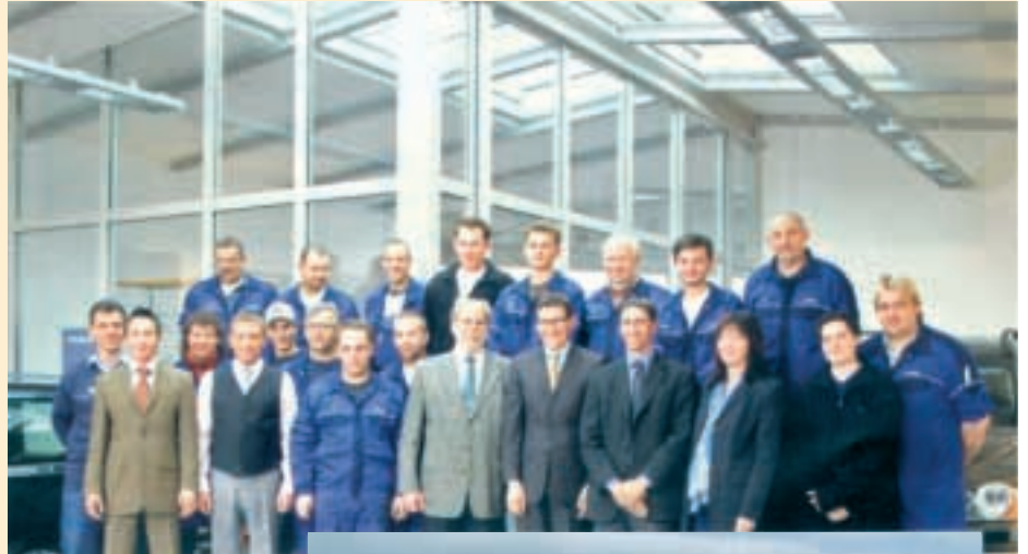
Das Team von Auto Gerb: freundlich und kompetent.

Es ist soweit: Nach umfangreichen Umbauarbeiten erstrahlt unser Autohaus in Baierbrunn in neuem Glanz. Das möchten wir gerne mit Ihnen feiern und laden Sie zu unserer Neueröffnung am Samstag, dem 11. Juni , in unser Autohaus zu einem „Tag der offenen Tür“ für die ganze Familie ein. Erleben Sie unsere neu gestalteten großzügigen Räumlichkeiten mit dem attraktiven Showroom und werfen Sie einfach mal einen Blick hinter die Kulissen. So ist unsere Werkstatt mit den modernsten Analysegeräten ausgestattet und für alle Servicearbeiten bestens gerüstet. Selbstverständlich wird an diesem Tag auch für Ihr leibliches Wohl bestens gesorgt. Schauen Sie einfach vorbei. Wir präsentieren Ihnen die aktuelle Volvo Modellpalette und zahlreiche attraktive Angebote. Wir würden uns freuen, Sie am 11. Juni bei uns begrüßen zu dürfen.