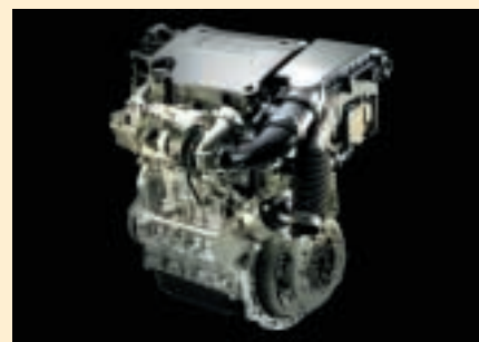
Kraftvoll und äußerst ökonomisch: der neue 1,6 Liter Dieselmotor.