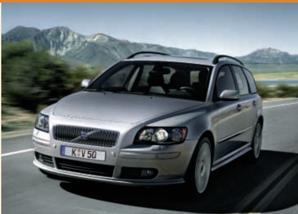
Sportlich, dynamisch, komfortabel: Der Volvo V50 begeistert durch exzellente Fahrleistungen, höchste Verarbeitungsqualität und günstigen Verbrauch.

Die umfangreiche Motorenpalette mit fünf verschiedenen Benzin- und zwei Dieseltriebwerken gewährleistet exzellente Fahrleistungen bei niedrigem Verbrauch. Besonders sparsam sind die neuen 1,6-Liter-Diesel- und Benzinaggregate mit 110 PS (81 kW) bzw. 100 PS (74 kW). Der 1,6-Liter Benziner benötigt nur 7,2 Liter auf 100 Kilometer, der Diesel begnügt sich sogar mit lediglich 5,0 Litern. Der Volvo V50 ist jetzt ab 22.200 Euro erhältlich. Ein Grund mehr, eine Probefahrt hier im Autohaus zu vereinbaren. Bei acht Motorvarianten (inklusive einer Allradversion) und vier Ausstattungspaketen stehen 32 Möglichkeiten zur Wahl: Da wird auch für Sie das passende Modell dabei sein.