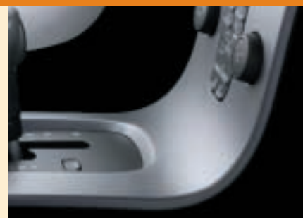
Design-Highlight: die scheinbar freischwebende Mittelkonsole.