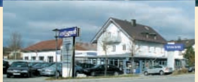
Die neu gestaltete Niederlassung von Auto Gerb in Baierbrunn.