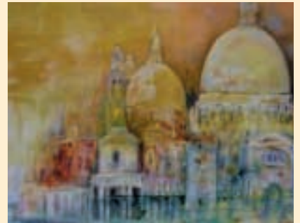
Venedig, St. Maria della Salute.